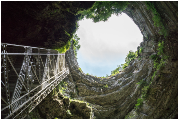
La gueule béante du monstre

Dès que l'on laisse les gondoliers, on peut à nouveau faire chauffer le capteur [?.]. Et quel spectacle!