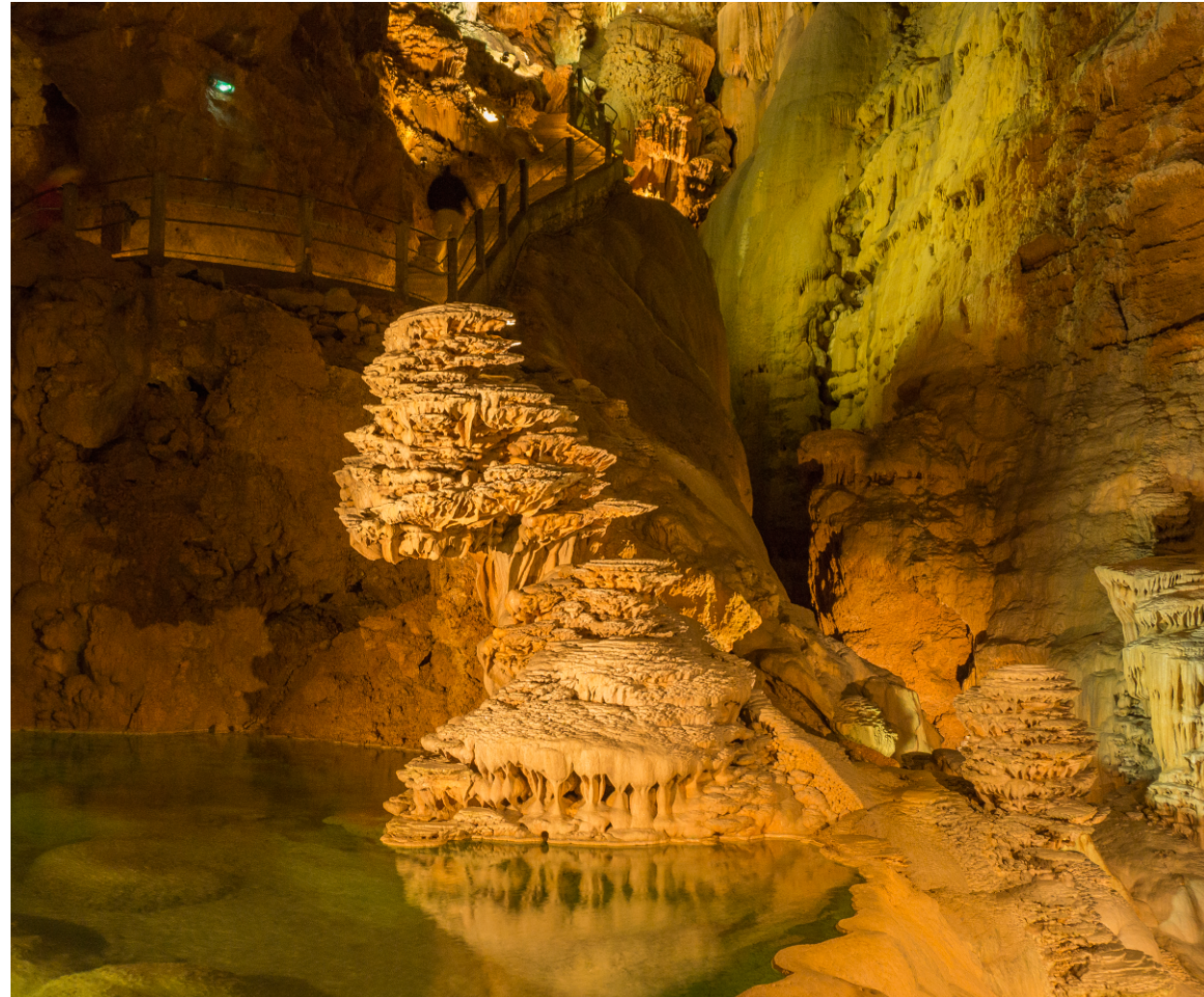
Quelques milliards de gouttes d'eau pour façonner cette oeuvre