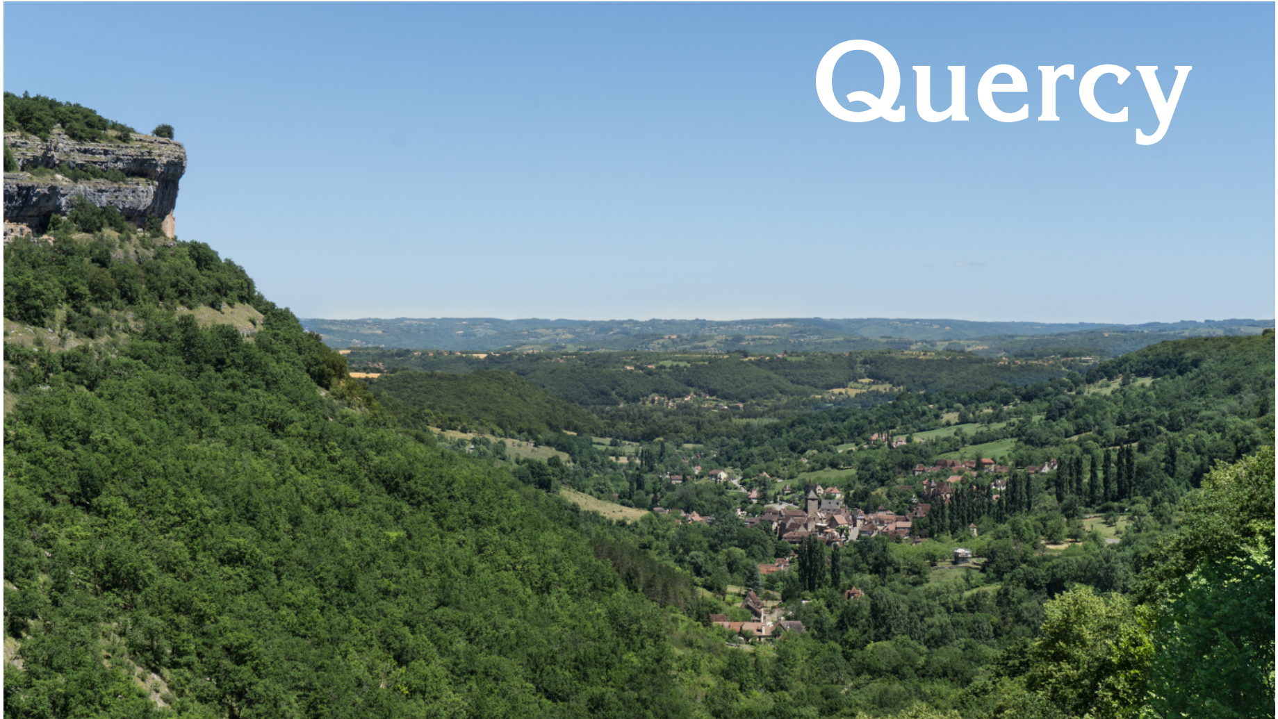
Village d'Autoire dans son écrin de verdure