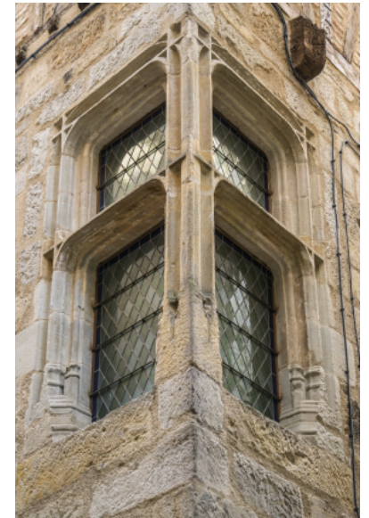
Images © Patrick Rechsteiner Composé sur Adobe InDesign CC-2015 - Images traitées sur Adobe Photoshop Lightroom 5